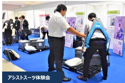
アシストスーツ体験会

一般社団法人アシストスーツ協会による 東北初のアシストスーツ体験会 の開催、 学生&企業交流ひろば の設置、高校生「橋梁模型」作品発表会の入賞作品展示、技術パネル（ICT）展示を行い、多くの来場者にご覧いただきました。