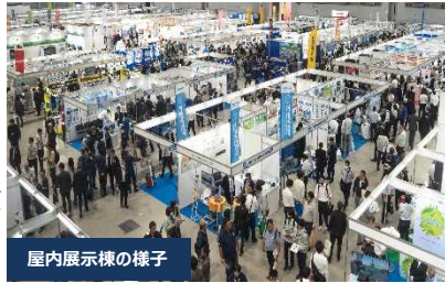
屋内展示棟の様子

「設計・施工」、「維持管理・予防保全」、「防災・安全」、「その他分野」の4分野に 378出展者 による 958技術 が集結。各ブースでは展示、実演、体験など様々な方法による紹介が行われ、建設技術の「今」を体感していただきました。