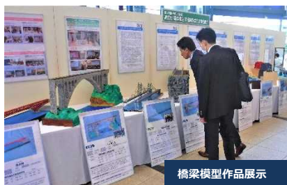
橋梁模型作品展示