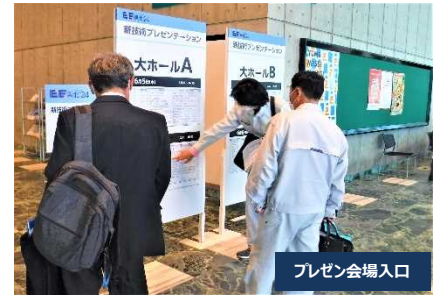
プレゼン会場入口