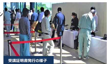
受講証明書発行の様子

EE東北'24では、CPD/CPDSのガイドラインに基づくプログラムとして認定を受けており、 CPD受講者985名、及びCPDS受講者1,238名 に証明書を発行しました。