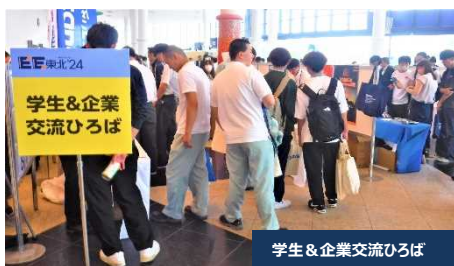
学生&企業交流ひろば