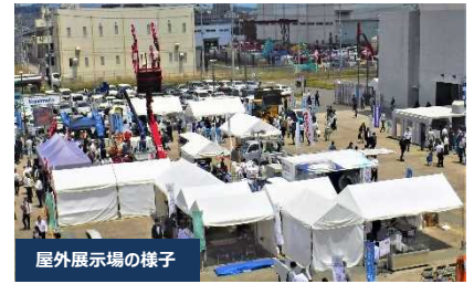
屋外展示場の様子