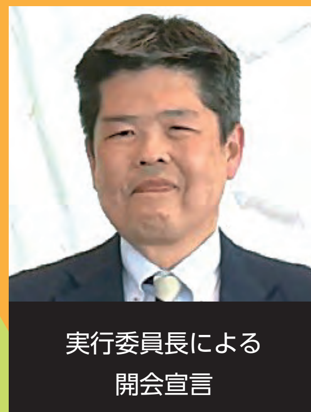
実行委員長による 開会宣言

第32回の開催となる「EE東北'23」は、6月7日(水)10時から、EE東北実行委員長の開会宣言及び、構成団体代表等15名のテープカットにより開幕しました。