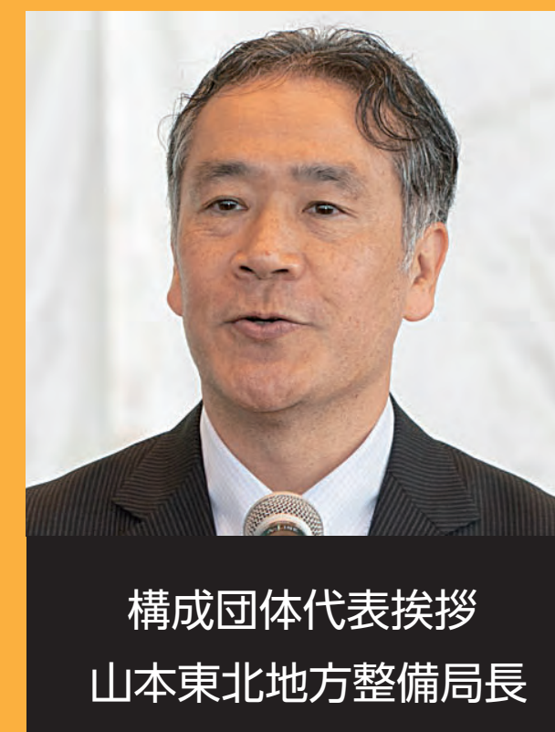
構成団体代表挨拶 山本東北地方整備局長