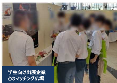
学生向け出展企業とのマッチング広場

学生向けに出展企業とのマッチング広場の設置、高校生「橋梁模型」作品発表会の入賞作品展示、技術パネル（ICT）展示、 インフラメンテナンス写真展 等を行い、多くの来場者にご覧いただきました。