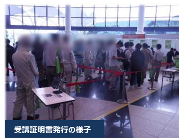
受講証明書発行の様子

EE東北'23では、CPD/CPDSのガイドラインに基づくプログラムとして認定を受けており、 CPD受講者942名、及びCPDS受講者1,173名 に証明書を発行しました。