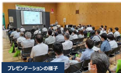
プレゼンテーションの様子

会議棟A・Bで行われた出展者による新技術のプレゼンテーション会場では、会場内のソーシャルディスタンスを保ちながら 2日間で約2,800人 の聴講者が訪れ、各プレゼンを熱心に聞き入っていました。