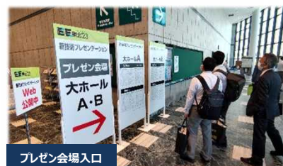
プレゼン会場入口