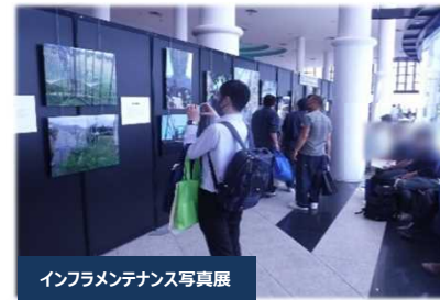
インフラメンテナンス写真展