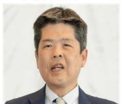
実行委員長による 開会宣言

第32回の開催となる「EE東北'23」は、6月7日(水)10時から、E E東北実行委員長の開会宣言及び、構成団体代表等15名のテープカットにより開幕しました。