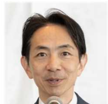
来賓祝辞 国土交通省 森下参事官