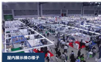
屋内展示棟の様子

「設計・施工」、「維持管理・予防保全」、「防災・安全」、「その他分野」の4分野に 過去最大の385出展者による1,035技術 が集結。各ブースでは展示、実演、体験など様々な方法による紹介が行われ、来場者には十分なコロナ対策のうえ、建設技術の「今」を体感していただきました。