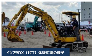
インフラDX（ICT）体験広場の様子

サテライト会場で行われたインフラDX（ICT）体験広場では15出展者による展示が行われ、 2日間で延べ3,100人 の見学者が訪れ、実際に大型建設機械等に触れながらICTを体験いただきました。