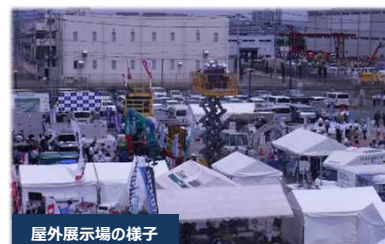
屋外展示場の様子