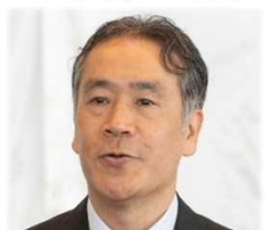
構成団体代表挨拶 山本東北地方整備局長